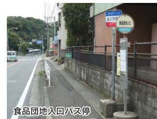
食品団地入口バス停