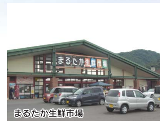
まるたか生鮮市場