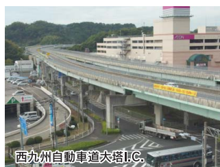
西九州自動車道大塔I.C.