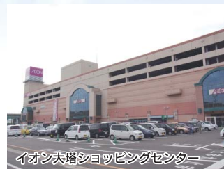
イオン大塔ショッピングセンター

さざ歯科医院……………車 約3分 たかはし小児科……………車 約3分 高橋脳神経外科内科……………車 約3分 もみじが丘調剤薬局……………車 約3分 大塔内科医院……………車 約2分