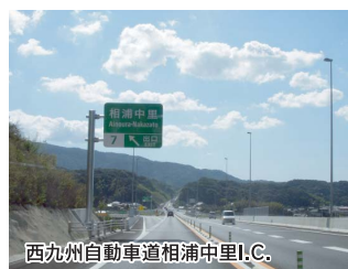
西九州自動車道相浦中里I.C.