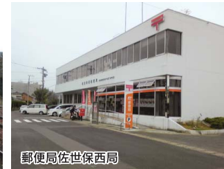
郵便局佐世保西局